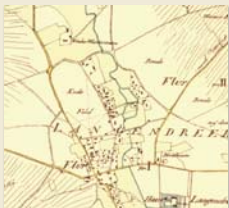
Das Bauerndorf Langendreer im Jahre 1823