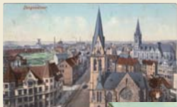
Blick auf den Ortsteil „Bahnhof“ mit der Kaiserstraße im Jahre 1906. Im Vordergrund die Lutherkirche, dahinter die Marienkirche und im Hintergrund u.a. die Zechen Mansfeld und Vollmond.