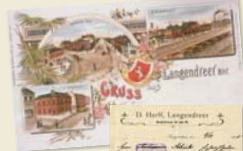
Postkartengröße Ende des 19. Jahrhunderts aus Langendreer. Der ehemalige Bahnhof und seine nähere Umgebung.