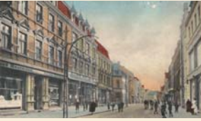
Blick in die Kaiserstraße