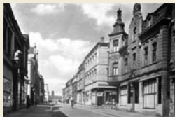
Die Kaiserstraße 1937. In diesem Jahr existieren am Alten Bahnhof nur noch die beiden Alberg Kaufhäuser, die dann im Sommer des folgenden Jahres „ansatz“ werden.