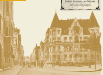
Links: Ecke Wörthstraße/ Kaiserstraße; heute: Ecke Wittenbergstraße/Alte Bahnhofstraße