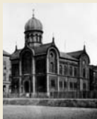
Im November 1938 wird die Wittener Synagoge, geistliches Zentrum auch der Langendreerer Juden, durch Nationalsozialisten zerstört.