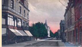
Konfektionsgeschäft Gebr Alsberg in der Kaiserstraße 186 (sorne links)