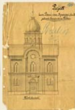
Bauzeichnung von 1884 der geplanten Wittener Synagoge, die 1885 errichtet wird.