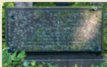
Grabstein auf dem jüdischen Friedhof Witten mit der Inschrift: