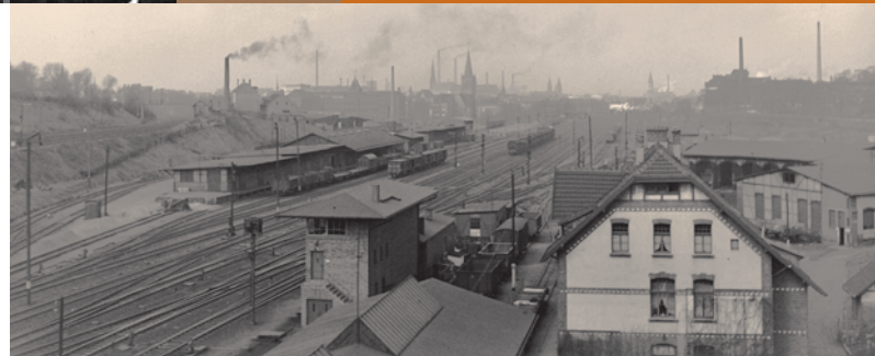
Nordbahnhof Bochum, 1920er Jahre